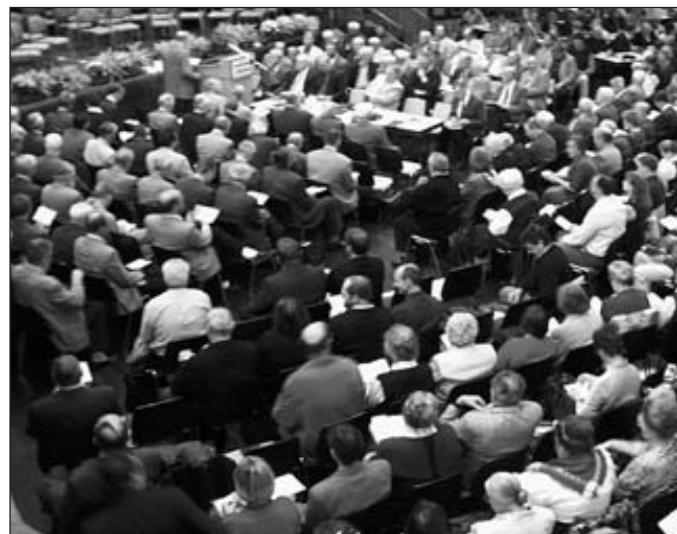
Eine Bewegung unter dem Wort

Die Brüdergemeinden wollen neutestamentliche Versammlung der Gläubigen sein - schnörkellos, kompromisslos, bibeltreu.