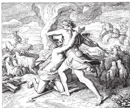
Der Brudermord. Schnorr von Carolsfeld, 1860

Das ist bis heute so geblieben! Kann man an meinem Handeln