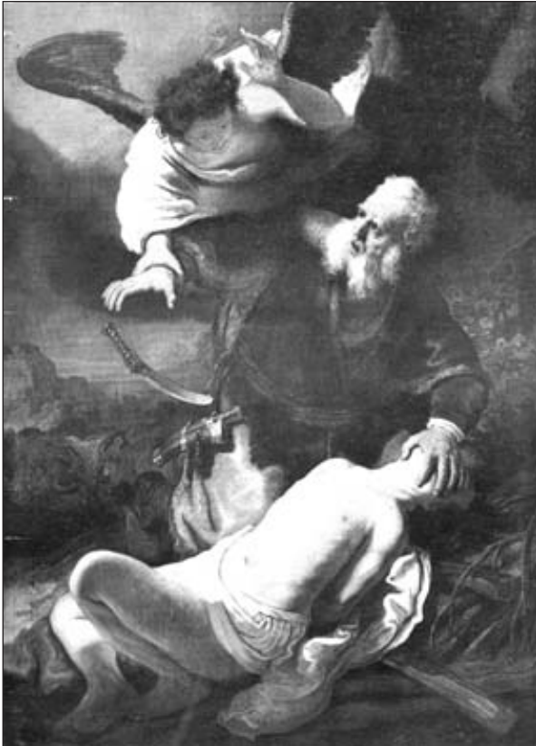
Opferung Isaaks. Öl auf Leinwand, 1635, Rembrandt van Rijn