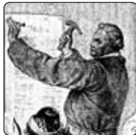
Martin Luther schlägt am 31. Oktober 1517 die 95 Thesen an die Schlosskirche von Wittenberg.

Was als kleines und unscheinbares Feuerchen in Wittenberg begann, entwickelte sich schnell zu einem Flächenbrand, der innerhalb von 140 Jahren ganz Europa verändern sollte. Zunächst einzelne Personen, dann Landesfürsten und schließlich ganze europäische Staaten wandten sich vom alten katholischen Glauben ab und suchten eine Erneuerung von Glaube und Kirche. Deutschland entwickelte sich dabei zu einem klassischen Reformationsland. Der erneuerte Glaube prägte den Einzelnen und genauso Staat und Gesellschaft. Dass