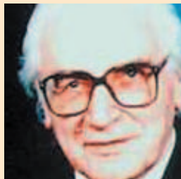
1938: Konrad Zuse baut den ersten Computer

1938 wurde von dem deutschen Erfinder Konrad Zuse (1910-1995) der weltweit erste programmgesteuerte Rechner gebaut. Computer haben inzwischen alle Zweige der Wissenschaft und Wirtschaft erobert, und an das Internet sind heute (2002) mit stark steigender Tendenz weltweit mehr als 200 Millionen Nutzer angeschlossen.