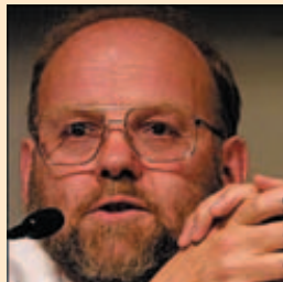
1996: Ian Wilmut klont das Schaf Dolly

Der schottische Embryologe Ian Wilmut klonte 1996 das Schaf Dolly. Erstmals gelang es, eine normale Körperzelle so zu manipulieren, dass sie sich wie eine befruchtete Eizelle zu teilen begann und zu einem normalen Embryo entwickelte.