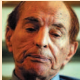
3.12.1967: Chr. Barnard, Herztransplantation

Am 3. Dezember 1967 wurde durch den südafrikanischen Arzt Christiaan Barnard erstmals ein menschliches Herz erfolgreich verpflanzt. Inzwischen sind weltweit 50.000 Herzen transplantiert worden.