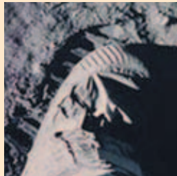
21.7.1969: Neil Armstrong betritt den Mond

Am 21. Juli 1969 setzte ein Mensch erstmals seinen Fuß auf den Mond. Der Astronaut Neil Armstrong rief uns voller Stolz vom Erdtrabanten den Satz zu: „Ein kleiner Schritt für einen Menschen, aber ein Riesenschritt für die Menschheit.“