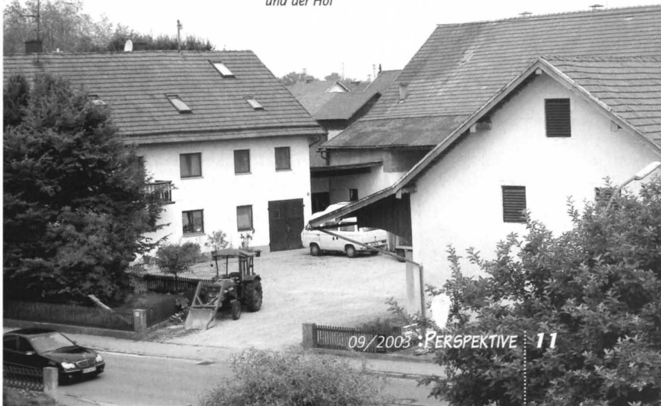
Foto: Moosinning. Lebenshaus 1 und der Hof

Im Fazit: Egal, ob Christ oder Nichtchrist: ohne Genügsamkeit gibt es kein Glück. Wenn man aber genügsam ist und zudem auch noch eine persönliche Beziehung zu Gott hat, dann bleibt man bewahrt vor vielem, was einem nichts als Schmerzen einbringt. Im Gegenteil, man erlebt einen großen Gewinn. Und wer sich auf der Gewinnerseite des Lebens wiederfindet, ist glücklich.