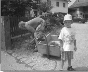
Zur Arbeitstherapie gehört auch Hof- und Gartenpflege