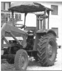
Unser Traktor (von den Bewohnern renoviert)