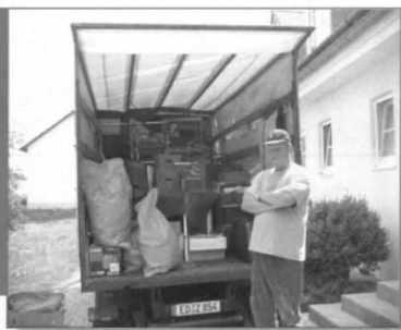
Zur Arbeitstherapie gehören auch Umzüge