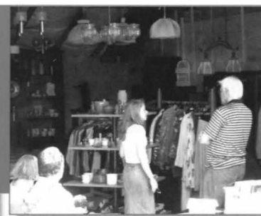
Unser neuer Second-Hand-Laden hatte am Tag der offenen Tür Eröffnung.

wo wir selbst noch als Bedürftige, getragen von der Gnade des Herrn und der der Geschwister, zu leben haben.