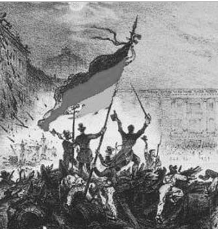
Revolution in Deutschland. Zeitgenössische Illustration

Was unterscheidet Jesus Christus von den Revolutionären der französischen Revolution? Jesus hat nicht nur Forderungen gestellt, er hat sie