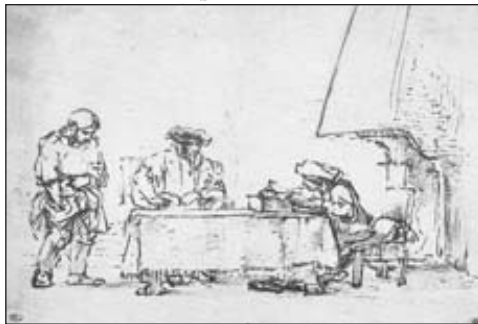
Rembrandt van Rijn. Gleichnis von den anvertrauten Talenten. Federzeichnung, Bister, 17,3 x 21,8 cm, um 1652, Paris, Louvre