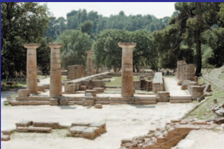
Fotos v.l.n.r.: Olympia Tribüne; Illustration der Olympischen Spiele (19.Jh); Olympia Tempelsäulen; Olympia Ruinen