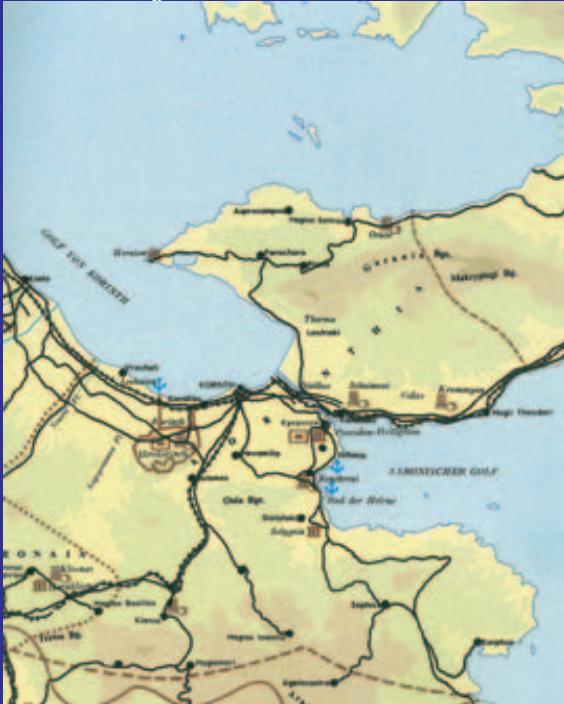
Lageplan von Korinth am Isthmischen Golf