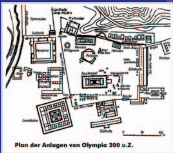
Plan der Anlagen von Olympia 200 u.Z.