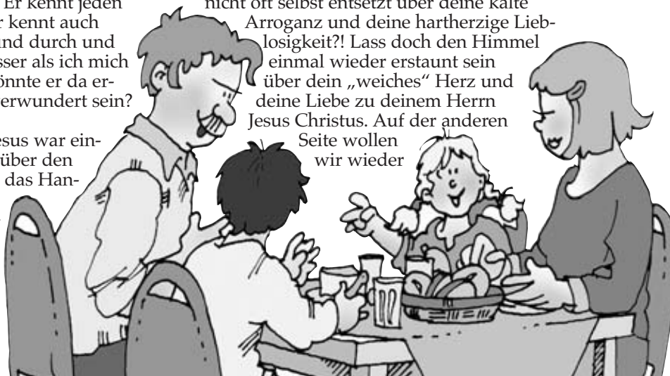
Illustration: Saskia Klingelhöfer