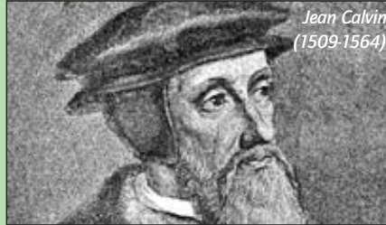
Jean Calvin (1509-1564)

Es war klar, dass die Reformatoren im 16. Jahrhundert neben vielen anderen Anliegen am Herrenmahl, wie es in der katholischen Kirche geübt wurde, nicht vorübergehen konnten. Schon der Name wurde geändert. Das deutsche „Abendmahl“, das als neutraler Ausdruck das ursprüngliche Geschehen bezeichnete, ersetzte „Eucharistie“, das nur einen Aspekt des Herrenmahls berücksichtigte.