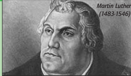
Martin Luther (1483-1546)