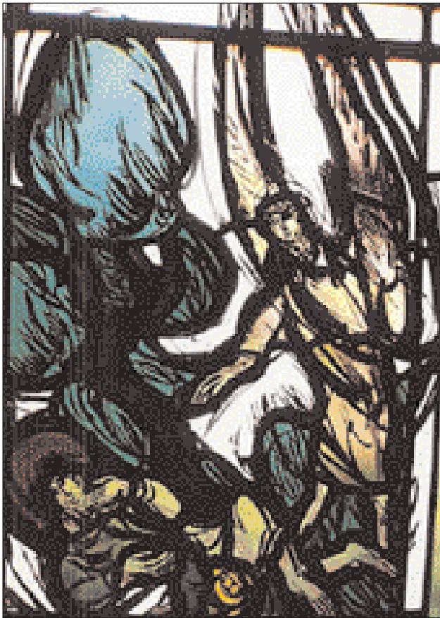
Elia unter dem Ginsterstrauch. Glasfenster im Kloster Karmel St. Elija, Ohrdruf, Bayern

F ür König Ahab begann der Tag wie alle anderen zuvor auch. Er saß auf seinem Thron im Audienzsaal. Neben ihm hatte Königin Isebel Platz genommen. Mit einem Mal öffnet sich die Tür und ein Mann tritt herein. Ohne sich an die vorgeschriebenen Verbeugungen zu halten, geht er geradewegs auf den Herrscher zu und übermittelt ihm ziemlich bestimmt die Wettervorhersage für die kommenden Jahre: „Es wird in der nächsten Zeit weder Tau noch Regen geben, es sei denn ich sage es!“ Ehe sich das Regentenpaar und die Hofgesellschaft von der Plötzlichkeit des göttlichen Ultimatus erholt haben, hat sich der mutige Fremde auch schon auf dem Absatz umgedreht und ist durch das Eingangsportal verschwunden.