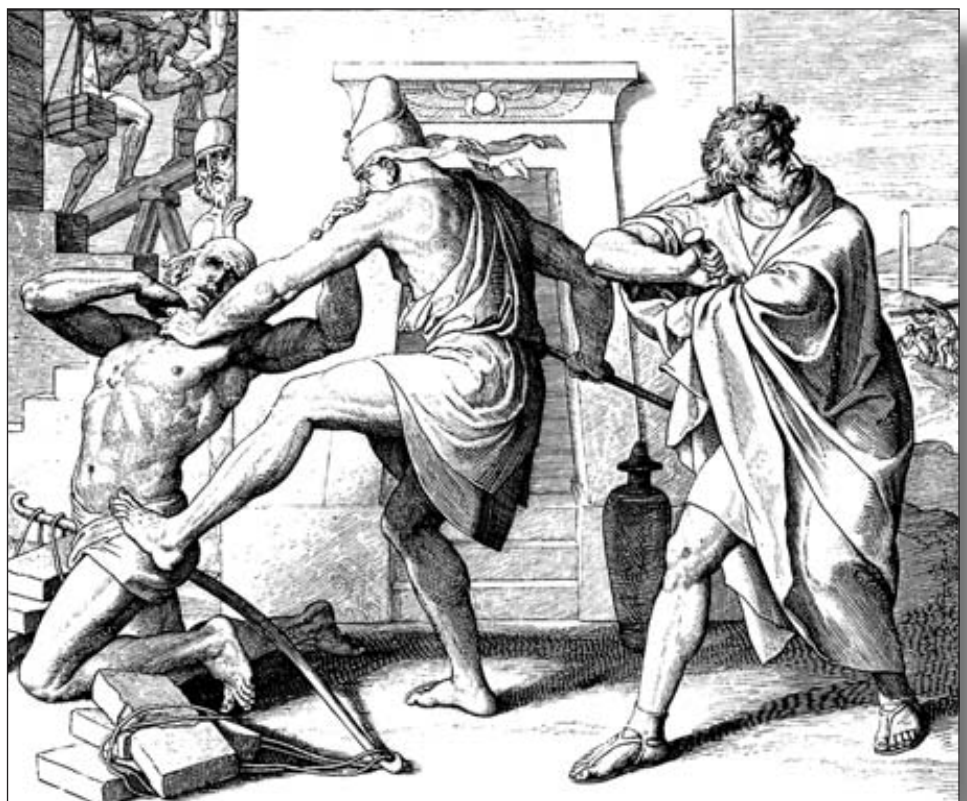
Mose erschlägt einen Ägypter. Schnorr von Carolsfeld, 1860

Gott schlägt zu – erst gegen Menschen, die so etwas tun, dann gegen Jesus Christus, der die Gewalt der Menschen nicht mehr bekämpft, sondern erleidet. Gottes letzter „Schlag“ ist die Bereitschaft, sich schlagen zu lassen, wenn es denn keinen anderen Weg gibt, Menschen aus dem Zirkel von Gewalt und Gegengewalt herauszureißen. Diese Gewaltlosigkeit Gottes angesichts des Kreuzes ist erstaunlich, wenn man bedenkt, wie sehr Gott in Jesus Christus beleidigt und verspottet wird. In detaillierter Schilderung berichten uns die Evangelisten, wie Jesus konsequent gefoltert und entwürdigt wurde, sei es durch die Ohrfeigen und Spottspiele der Soldaten, sei es durch die Spucke des Hohen Rates, sei es durch den Folterweg zum Todeshügel, sei es durch die umherstehenden Juden, die ihm noch in der entsetzlichen Qual am Kreuz auf den Arm nehmen und scheinbar offenherzig abwarten wollen, ob vor dem Tod dieses gequälten und entstellten Mannes doch noch Elia kommen könne, um ihn als echten König Israels zu bestä-