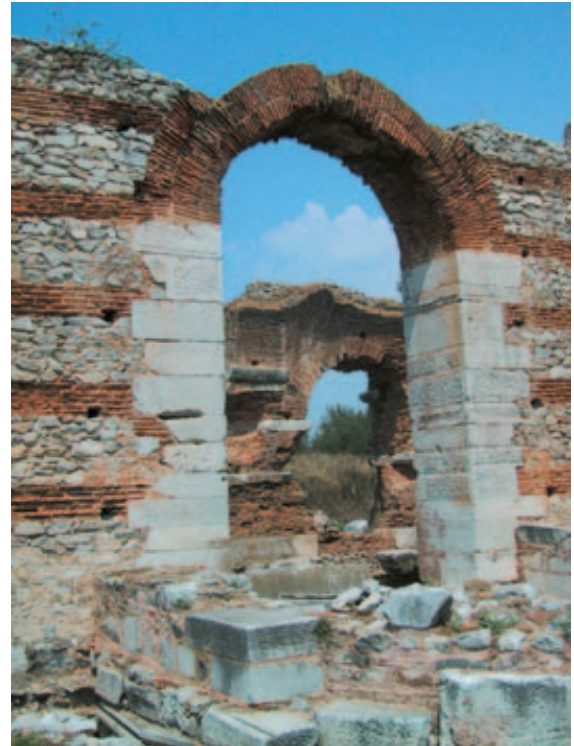
Torbogen im historischen Philippi.

Epaphroditus war kein Apostel; wir lesen nichts davon, dass er überhaupt predigte, und er zählte wohl auch nicht zum „Leitungs-