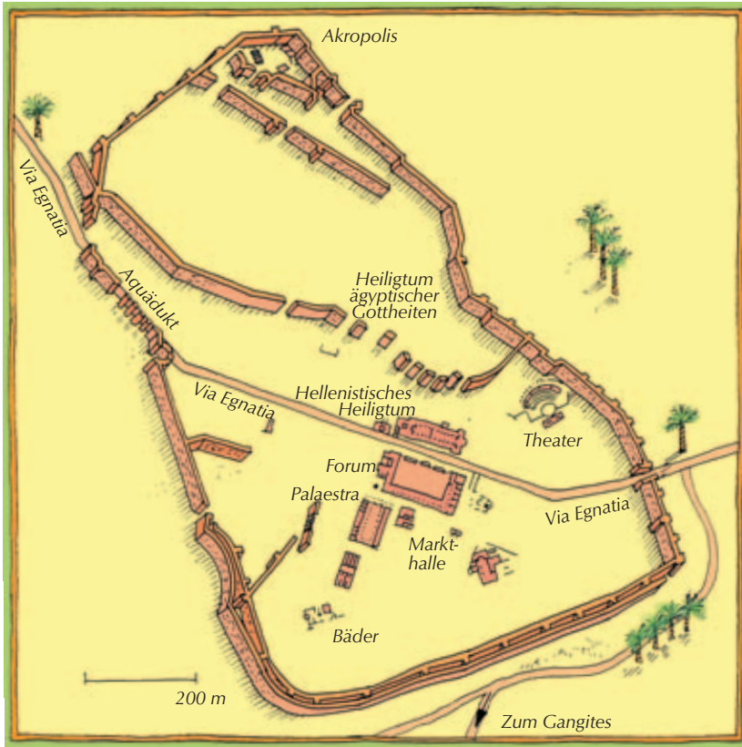
Stadtplan von Philippi. Zeichnung: Konni Alberts