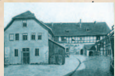
Ganz oben: Geburtshaus Müllers in Kroppenstedt. links: Domgymnasium Halberstadt. oben: Gymnasium Nordhausen

mit nach Schönebeck, um ihn besser kontrollieren zu können. Nach den Plänen seines Vaters sollte Müller eigentlich auf das Gymnasium nach Halle gehen, weil dort strenge Regeln herrschten. Der Sohn überredete den Vater jedoch, ihn lieber nach Nordhausen zu schicken. Dort herrschten mehr Freiheiten. Im Oktober 1822 trat er tatsächlich ins Gymnasium in Nordhausen ein und blieb dort für 2 1/2 Jahre, bis Ostern 1825. Immerhin hat sich dort sein Lerneifer gebessert. Er galt als Musterschüler. Auf dem Lehrplan standen die Lektüre der Klassiker, Französisch, Geschichte, Deutsch, Griechisch, Hebräisch und Mathematik. Besonders die Ausbildung in den Sprachen sollte für den späteren Dienst Müllers von Bedeutung sein, denn er sprach neben Deutsch Englisch und Französisch. Zudem kannte er die biblischen Sprachen Griechisch und Hebräisch. Auch in Nordhausen wohnte Müller im Hause des Direktors.