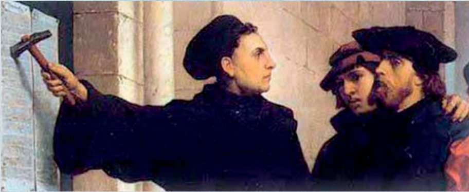
Luther schlägt die 95 Thesen an die Türe der Schlosskirche zu Wittenberg

Das eigentliche Erbe unserer Väter ist die Schrift