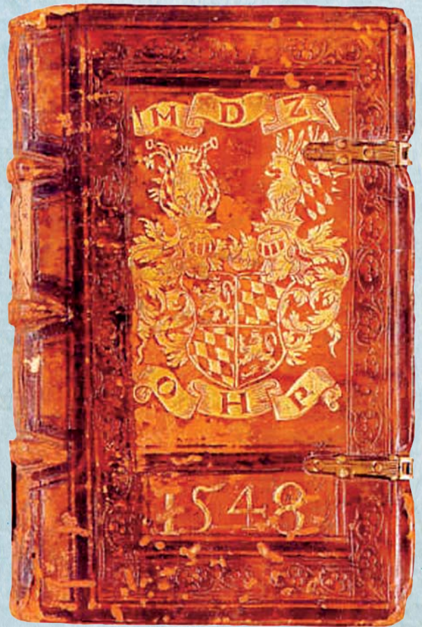
Die sog. Ottheinrichband-Bibel von 1548

2. Wir müssen aber auch eingestehen, dass solche Traditionen nicht der Schrift gleichgestellt sind, dass sie das rechte Verständnis der Schrift auch behindern können und dass sie nicht frei sind von menschlichen Irrtümern, auch wenn wir das dynamische Wirken des Geistes in unserer Geschichte meinen erkennen zu können. Wenn wir den unbedingten Vorrang der Schrift betonen, müssen wir ihr auch gestatten, unsere Auslegungstraditionen zu hinterfragen.