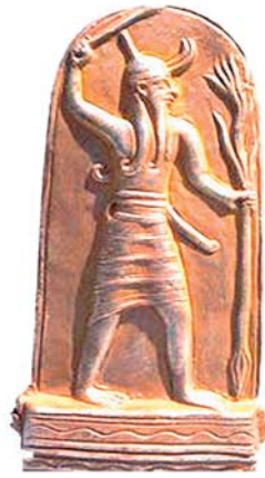
links: Elia-Denkmal auf dem Berg Karmel rechts: Der Wettergott Baal unten: Blick vom Karmel über die Jesreel-Ebene