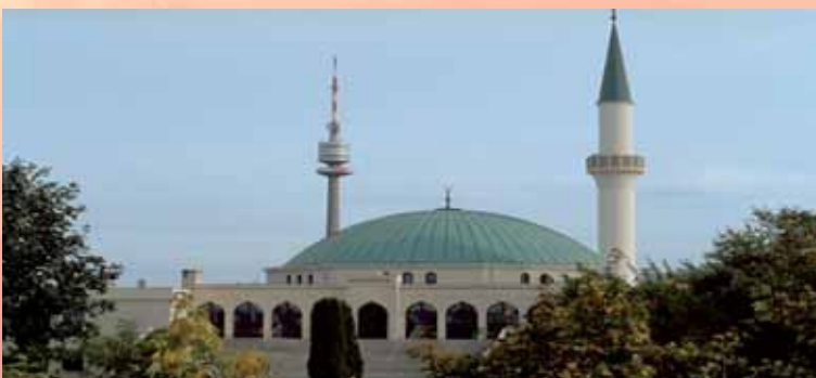
Moschee in Österreich

Es kann auch konkret werden. Das Verteilbuch: Markus Wäsch/Carsten Polanz, „Murat findet Jesus“ (CV-Dillenburger), steht zur Verfügung. Darin erzählen Dündar (Türke), Afrim (Albaner) und Serdar (Kurde) jeweils ihre Geschichte. Alle drei waren Muslime und haben sich zu Jesus Christus bekehrt. Die Zeugnisse sind spannende Geschichten, die Muslime mit Interesse lesen werden. Es wird unter Berücksichtigung des islamischen Hintergrunds das