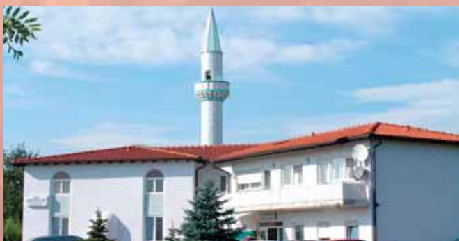
Moschee in Rheinfelden

Bedenken wir, dass in den meisten Ursprungsländern unserer muslimischen Mitbürger Mission schwer oder gar nicht möglich ist. Dafür schickt Gott viele von ihnen direkt vor unsere Haustür. Wer aber sieht das als eine Möglichkeit, ja mehr noch, als Herausforderung an, „alle Nationen zu Jüngern zu machen“ (Matthäus 28, 19)? Wir können Weltmission betreiben, ohne dafür unser Land