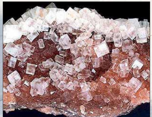
Halit, Neuhofer-Ellers/Deutschland

Zwei Wissenschaftler im Labor: Der eine kommt zu dem anderen und fragt: „Ist das ein ‚Y‘ oder ein ‚I‘?“ Da sagt der andere: „Das ist ein ‚I‘!“ Der andere Wissenschaftler bedankt sich, geht zurück in sein Labor. Kurze Zeit später gibt es im Nebenlabor eine gewaltige Explosion. Darauf sagt der andere Wissenschaftler: „Es scheint wohl doch ein ‚Y‘ gewesen zu sein.“