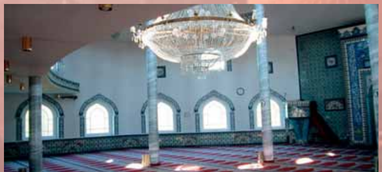
Moschee in Dortmund-Hassel