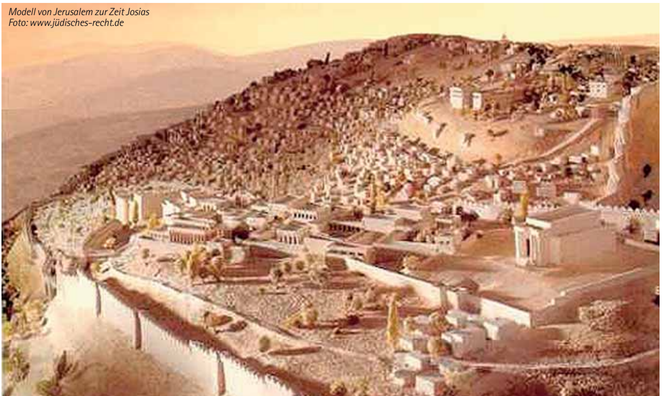
Modell von Jerusalem zur Zeit Josias

Und im achten Jahr seiner Regierung, als er noch ein Junge war, fing er an, den Gott seines Vaters David zu suchen. Und im zwölften Jahr fing er an, Juda und Jerusalem von den Höhen und den Ascherim und den geschnitzten und den gegossenen Bildern zu reinigen.