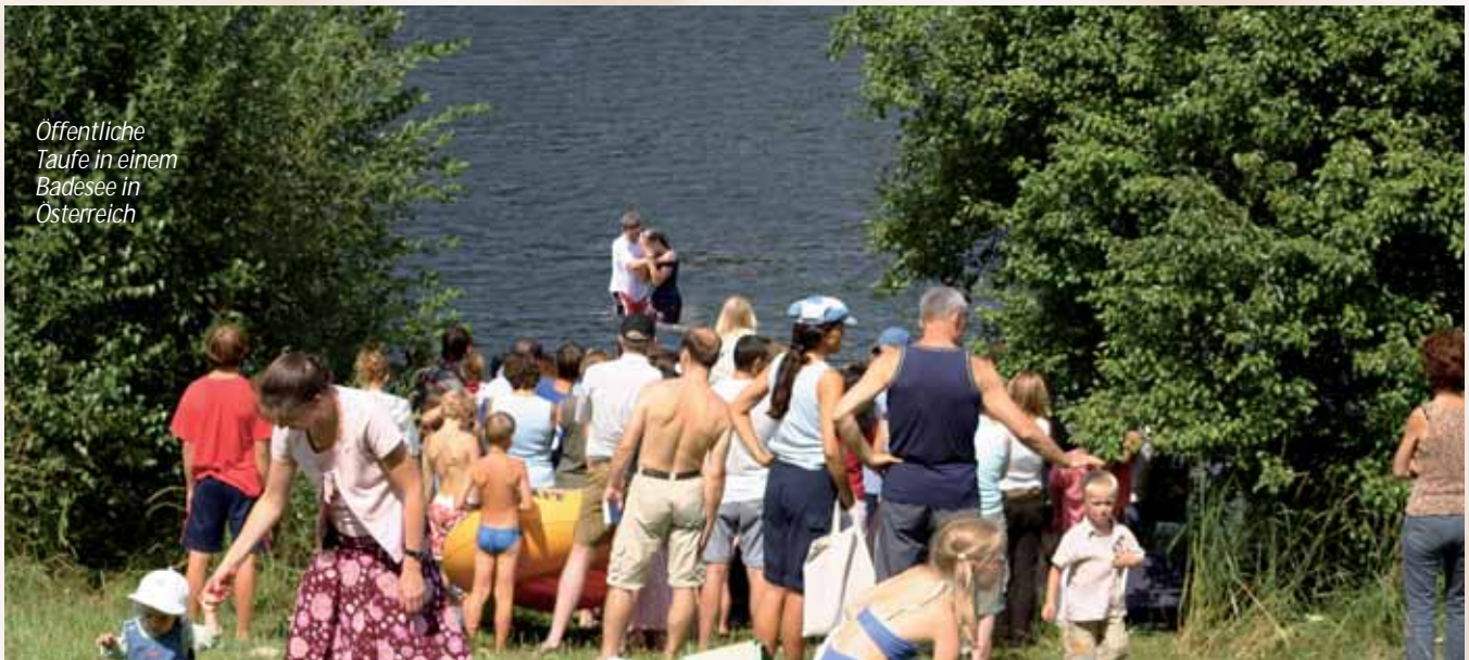
Öffentliche Taufe in einem Badensee in Österreich

In Apostelgeschichte 8,14-16 (Philippus in Samaria) wird deutlich, dass Menschen, die zuerst das Wort Gottes angenommen hatten, getauft worden waren. Die Taufe des äthiopischen Finanzministers in Apostelgeschichte 8 weist in dieselbe Richtung. Der reisende Ausländer hatte zuerst durch den Evangelisten Philippus die gute Nachricht von Jesus gehört und dann - nachdem er das Wort angenommen hatte - bat er um die Taufe.