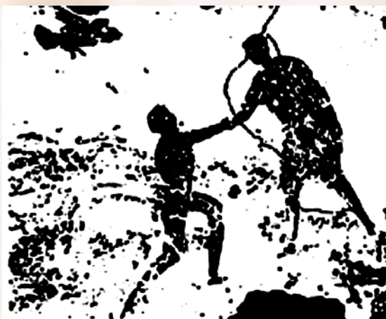
Die Taufe Jesu. Freskenmalerei aus dem 2. Jh. n.Chr.

Es war der Kirchenvater Tertullian (150-223 n.Chr.), der zum ersten Mal um das Jahr 200 n. Chr. von der Kindertaufe sprach. Tertullian führte einen heftigen Kampf gegen die in Nordafrika aufkommende Kindertaufe (De baptismo). Dies zeigt, dass zu seiner Zeit die Kindertaufe noch nicht allgemeine Praxis geworden ist. Tertullian hielt die Kindertaufe für unnötig, da „Jesus ungetaufte Säuglinge gesegnet und ihnen das Reich Gottes zugesprochen hat“ (Matthäus 19,14). Der Kirchengeschichtler Kurt Aland schrieb: „Tertullian hält es also für richtig, Kinder erst zu taufen, wenn sie ein Alter erreicht haben, in dem ihnen ein eigentliches Verständnis des Christentums, ein eigenes Bekenntnis zu Christus möglich ist.“ Tertullian empfiehlt das Alter der Pubertät als das für