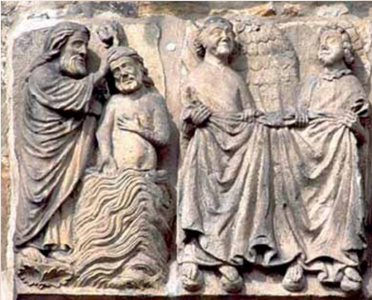
Die Taufe Jesu. Gotisches Relief im Dom zu Paderborn