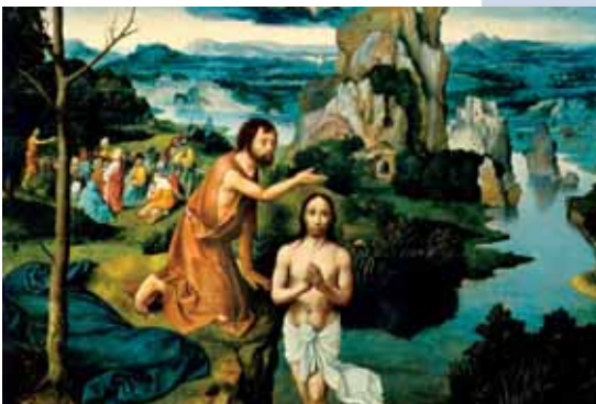
Die Taufe Christi, wie sie sich der italienische Maler Joachim Patinir (1480-1524) vorstellte (Öl auf Holz, 600 x 770 cm, Wien, Kunsthistorisches Museum)