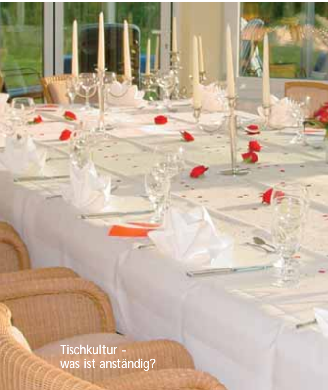
Tischkultur - was ist anständig?