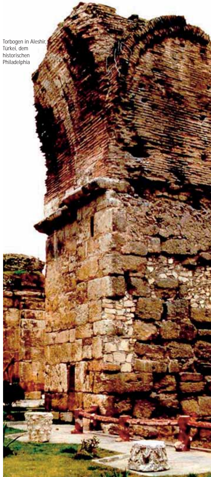
Torbogen in Aleshir, Türkei, dem historischen Philadelphia

Was ist die „ geöffnete Tür “? Zuallererst steht mir Jesus vor Augen, der sich selbst als „ die Tür “ und als „ den Weg “ zum Vater bezeichnet hat. Das bedeutet, dass Christus nicht nur den Schlüssel des Todes und des Totenreiches hat, sondern auch den Schlüssel zum Heil, zum