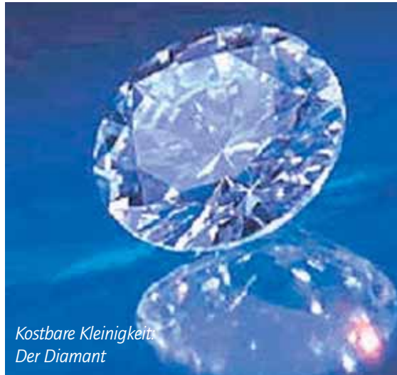
Kostbare Kleinigkeit. Der Diamant

In dem Buch „Die kleinen Chronik der Anna Magdalena Bach“ fand ich Überraschendes. Sie schreibt: „Ich möchte diese Chronik mit aller Genauigkeit schreiben, so genau, wie er (ihr Mann Joh. Sebastian Bach) sie würde haben wollen, denn ich erinnere mich noch deutlich der Art, wie seine Hand auf meine