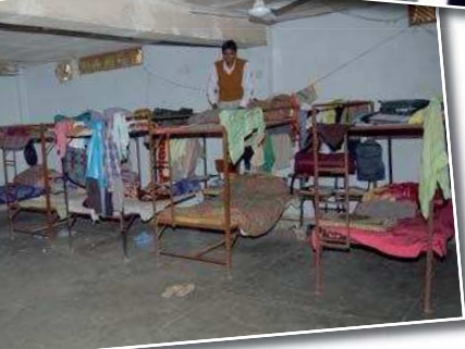
Schlafraum im Trainingscenter für Pastoren