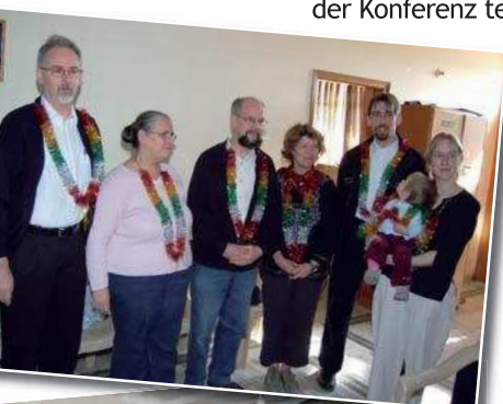
Empfang im Büro von EMPART

Das Ziel von solchen praktischen Hilfsprojekten, die von vollzeitlichen Mitarbeitern und ihren Ortsgemeinden durchgeführt werden, ist es, möglichst viele Menschen mit der Liebe Gottes zu erreichen. Viele Teilnehmerinnen machen einen Neuanfang mit Jesus, was Auswirkungen auf ganze Familien und Dorfgemeinschaften hat. Ein Nähzentrum konnten wir während unseres Aufenthalts leider nicht besichtigen, da die Nähkurse gerade abgeschlossen waren.