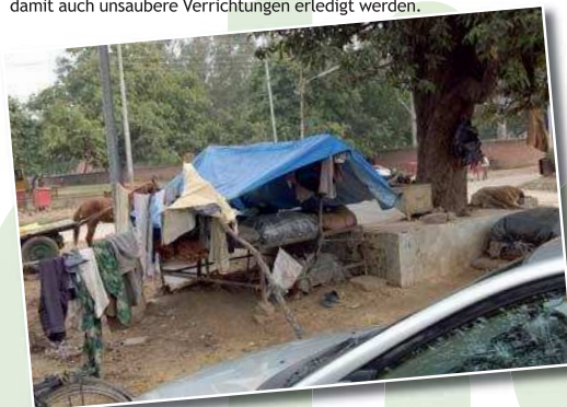
Ein Dach über dem Kopf in Neu-Delhi. Solche Behausungen sind keine Seltenheit. Wir haben auch Schlimmeres gesehen.