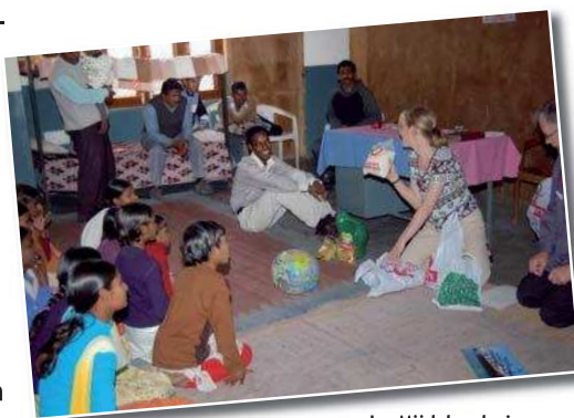
Im Mädchenheim Wir konnten Lebensmittel aus der Spende einer Gemeinde überreichen.

Schließlich ist nicht alles in Ordnung, wenn ein Kind in einem Heim Unterschlupf findet und statt einem Roti (indisches Fladenbrot) jetzt vier Rotis essen kann. Was ist mit Heimweh? Der Hausvater erklärt, dass er die ersten Tage besonders viel Zeit mit dem neuen Kind verbringt, mit ihm betet und aus der Bibel erzählt. Die Gefahr, dass ein Junge versucht, wieder nach „Hause“ zu laufen, ist da sehr groß. Die Zuneigung irritiert die Jungen, weil sie ungewohnt ist. Meist dauert es drei Wochen, bis das schlimmste Heimweh vorüber ist und die Kinder sich an ihre neue Familie gewöhnt haben.