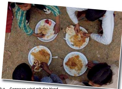
Gegessen wird mit der Hand. Meistens mit der rechten. Die Linke ist unrein, da damit auch unsaubere Verrichtungen erledigt werden.

Wir waren sicher, dass Gott uns beim Verarbeiten der Erlebnisse helfen würde.