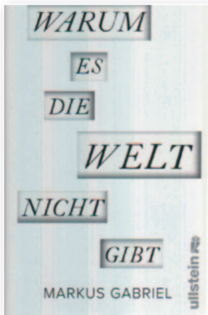
Markus Gabriel Warum es die Welt nicht gibt