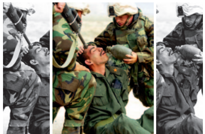
Das Bild zeigt einen irakischen Soldaten, umgeben von amerikanischen Soldaten im Irak-Krieg 2003. Foto: AP Photo/Itsuo Inouye; Montage: Ursula Dahmen/Der Tagesspiegel

Das folgende Bild zeigt ihnen, wie wichtig bei einem Bild der Bildausschnitt ist, der letztendlich gewählt wird.