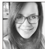
Texterin und Grafikerin, Mitarbeiterin bei der Christlichen Verlagsgesellschaft Dillenburg. lebt mit ihrem Mann und den beiden Kindern in Haiger.

Der Unterschied zwischen einem zufriedenen Nichtchristen und einem zufriedenen Christen ist der: Wer in Christus ruht, dessen Hunger ist auf ewig gestillt. Er muss nicht weitersuchen. Er darf in der Gewissheit leben und sterben, dass Christus allein genügt. Er darf danken, seinen Blick nach oben richten, sich demütigen und dienen. Denn das macht wirklich glücklich und zufrieden.