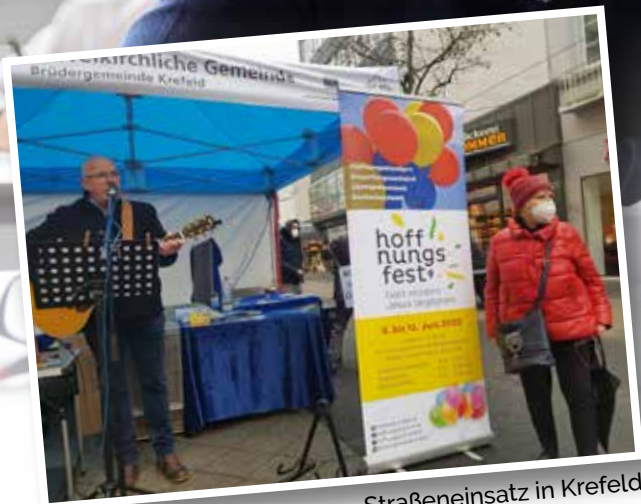
Straßeneinsatz in Krefeld

in Form von „Zweierschaften“ als bester Weg. Ein gutes Beispiel aus der Bibel ist die Beziehung zwischen Paulus und Timotheus. Dazu lese man die Timotheus-Briefe und schreibe alle Imperative auf! Dann wird man erkennen, wie umfassend Paulus um das Wachstum seines Mitarbeiters Timotheus besorgt war.